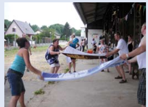
Allures de Kermesse rue des Merles