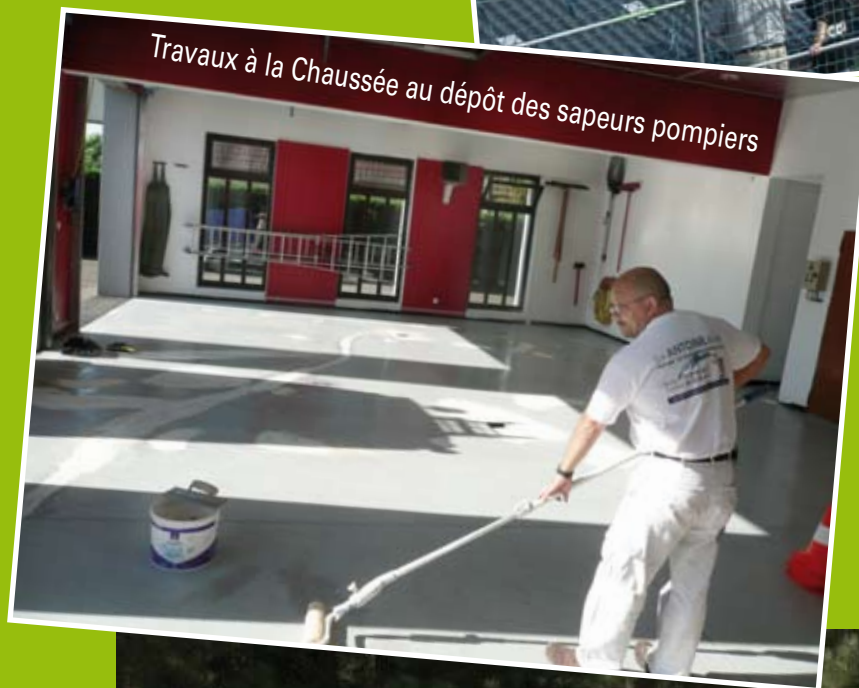
Travaux à la Chaussée au dépôt des sapeurs pompiers