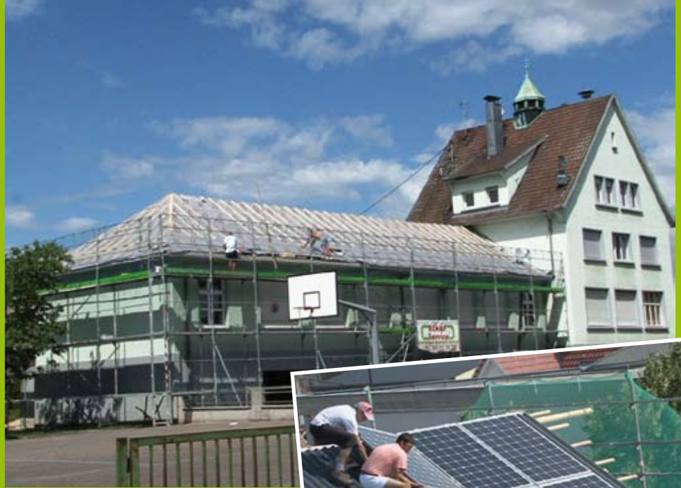
École Victor Hugo