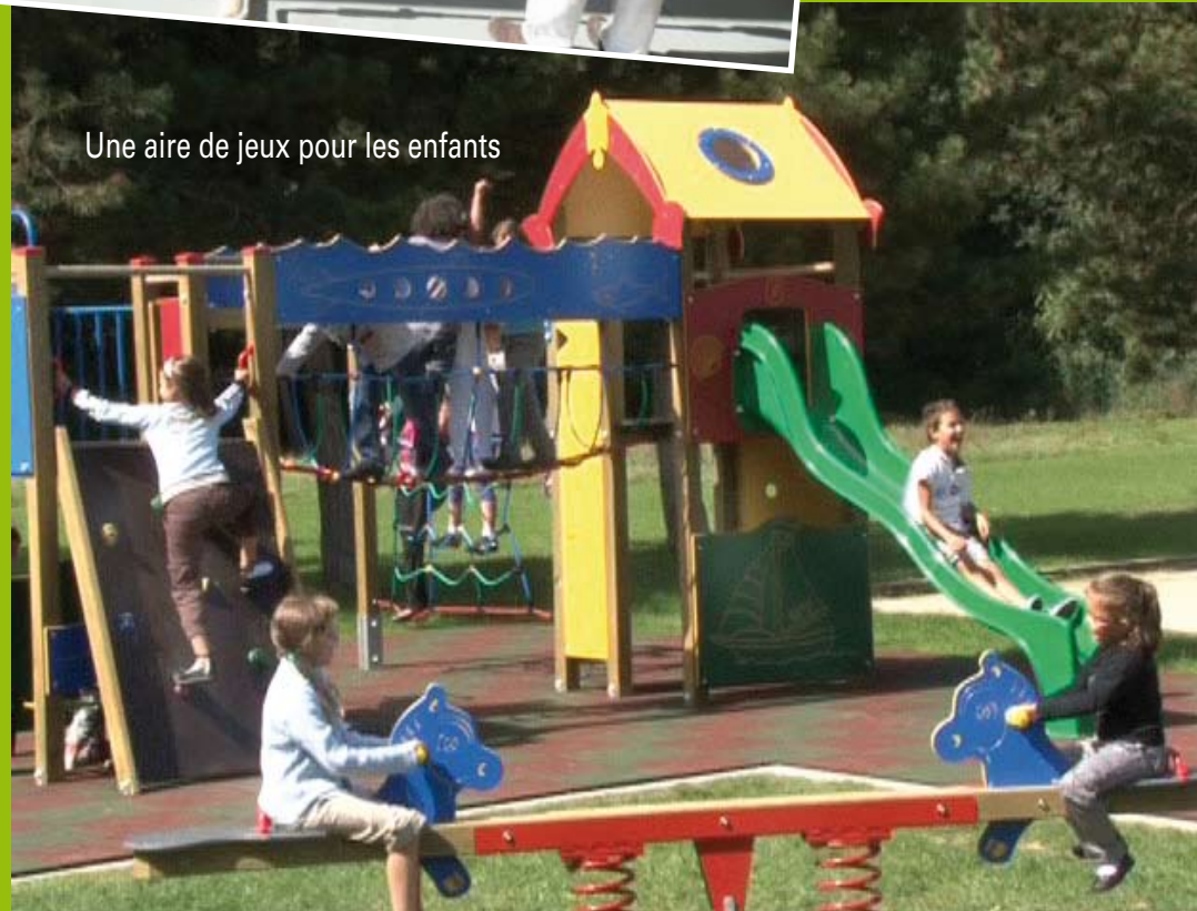
Une aire de jeux pour les enfants

Adressez candidature à M. le Maire de Bartenheim en Mairie 68870 Bartenheim