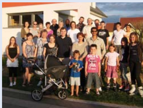
Quartier Schweitzer, rue Marie Curie

Depuis quelques années, certains quartiers de Bartenheim organisent la fête des voisins. C'est toujours un moment convivial où tout le monde participe en agrémentant le buffet pour un repas pris en commun, pour échanger et communiquer en toute sympathie le temps d'une journée.