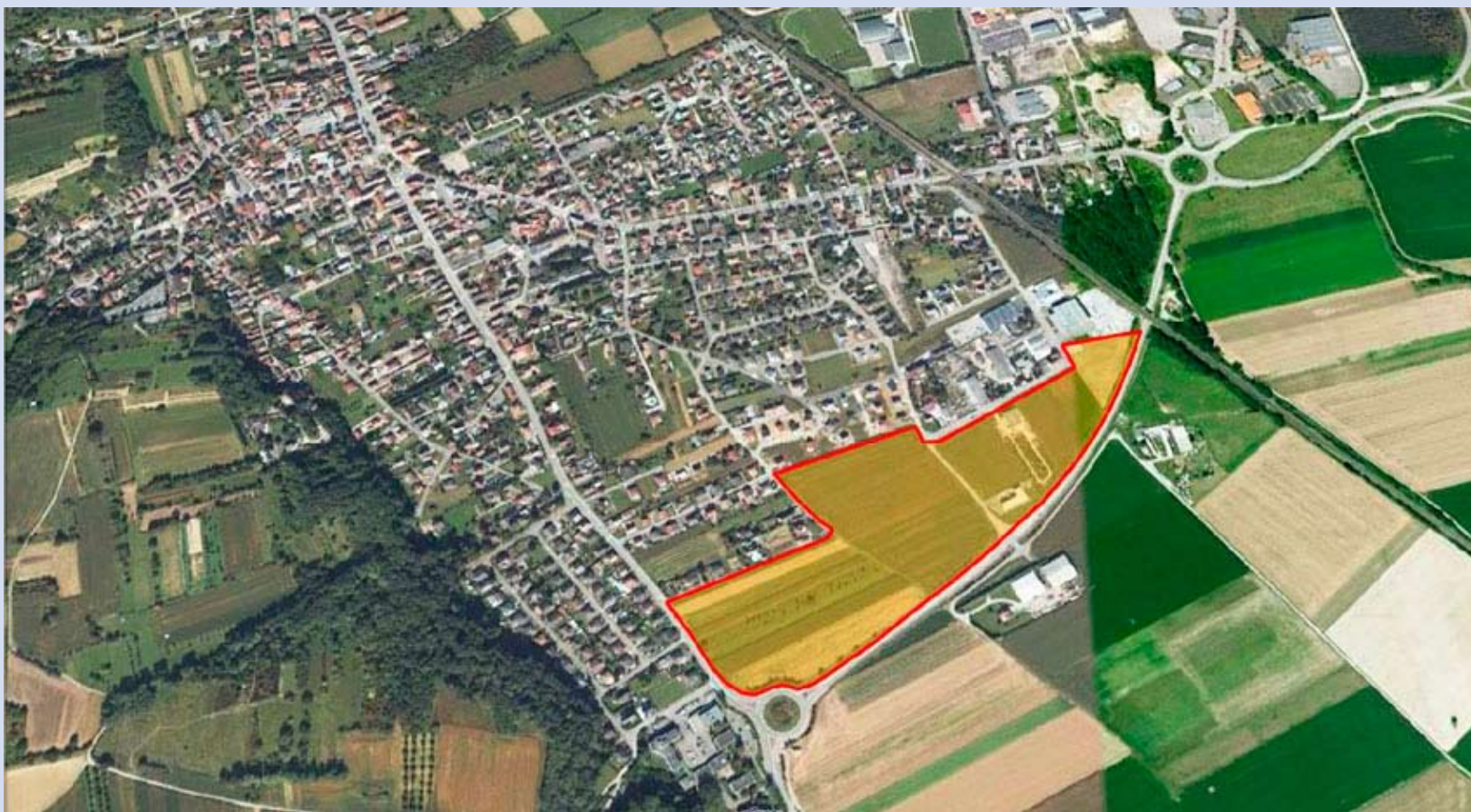
ZAC du Hattel

LA RÉUNION PUBLIQUE AURA LIEU DANS LA SALLE COMMUNALE DE LA MAISON POUR TOUS LE MERCREDI 20 AVRIL À 17H00.